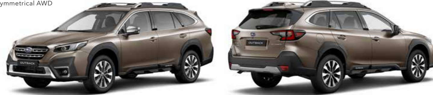
Brilliant Bronze Metallic

ABMESSUNGEN ..... L x B x H: 4.870 x 1.875 x 1.675 mm MOTOR ..... 2,5-Liter Vierzylinder-Boxer-Benzinmotor, DOHC, 16 Ventile HUBRAUM ..... 2.498 cm 3 MAX. LEISTUNG ..... 124 kW (169 PS) bei 5.000 - 5.800/min MAX. DREHMOMENT ..... 252 Nm bei 3.800/min ANTRIEB ..... Stufenloses Automatikgetriebe Lineartronic, permanenter Allradantrieb Symmetrical AWD