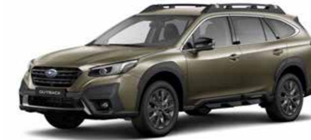
Autumn Green Metallic

ABMESSUNGEN ..... L x B x H: 4.870 x 1.875 x 1.670 mm MOTOR ..... 2,5-Liter Vierzylinder-Boxer-Benzinmotor, DOHC, 16 Ventile HUBRAUM ..... 2.498 cm 3 MAX. LEISTUNG ..... 124 kW (169 PS) bei 5.000 - 5.800/min MAX. DREHMOMENT ..... 252 Nm bei 3.800/min ANTRIEB ..... Stufenloses Automatikgetriebe Lineartronic, permanenter Allradantrieb Symmetrical AWD