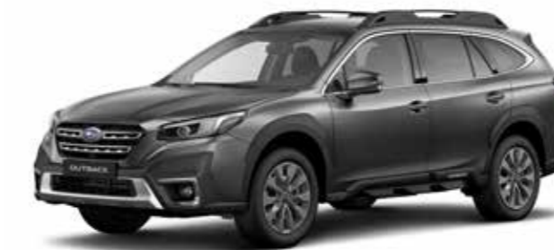
Magnetite Grey Metallic

ABMESSUNGEN ..... L x B x H: 4.870 x 1.875 x 1.675 mm MOTOR ..... 2,5-Liter Vierzylinder-Boxer-Benzinmotor, DOHC, 16 Ventile HUBRAUM ..... 2.498 cm 3 MAX. LEISTUNG ..... 124 kW (169 PS) bei 5.000 - 5.800/min MAX. DREHMOMENT ..... 252 Nm bei 3.800/min ANTRIEB ..... Stufenloses Automatikgetriebe Lineartronic, permanenter Allradantrieb Symmetrical AWD