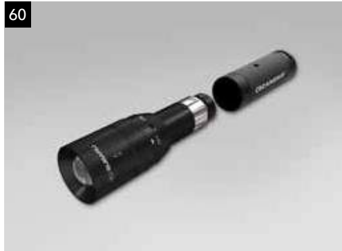
60 Wiederaufladbare Taschenlampe SESGFL1000

Hochwertiger Innenraumluftfilter mit Aktivkohle und antimikrobieller Beschichtung. Speziell für Allergiker geeignet.