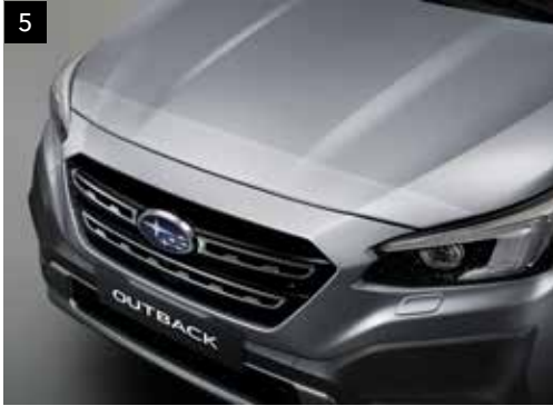
5 Steinschlagschutzfolie für die Fahrzeugfront