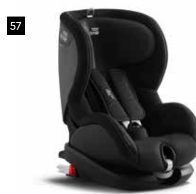
57 Kindersitz SUBARU Trifix 2 XP F410EYA250

Sichere und schnelle Befestigung dank ISOFIX-System. Ermöglicht dem Baby sich hinzulegen oder aufrechter zu sitzen.