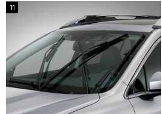
11 Wischerblätter vorne / hinten

Verhindert bei schlechtem Wetter das Eindringen von Regen/Schnee beim Fahren mit leicht geöffnetem Fenster.