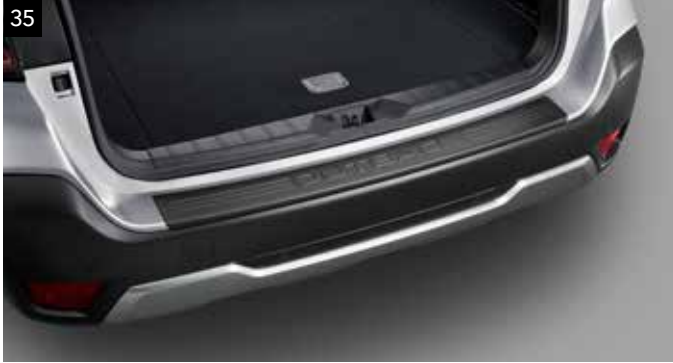
35 Ladekantenschutz Kunststoff (Schwarz)