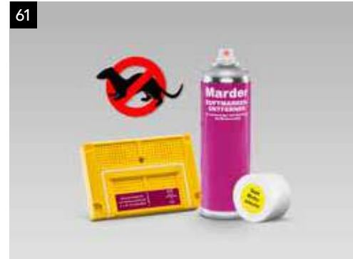
61 Marder Abwehrsystem SEGOYA9000

Die praktische Taschenlampe wird direkt über die 12 Volt-Steckdose aufgeladen. Die Taschenlampe hat eine Lichtstärke von 130 Lumen und eine Leuchtweite von bis zu 100 m.