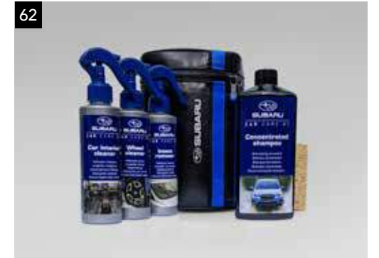
62 Pflegeset SEBAYA9000

Set bestehend aus einem Abwehrspray und einem Ultraschallgerät, das hilft Marderschäden zu verhindern.