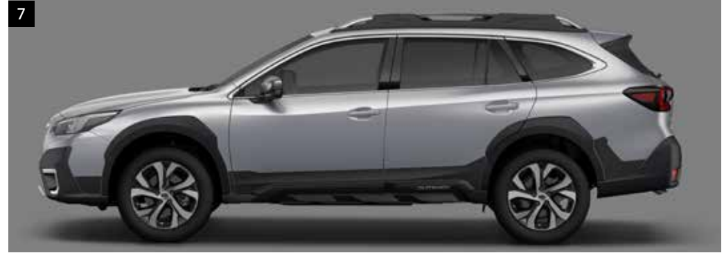
7 Stylingfolie für die Seitentüren

Transparente Folie zum Schutz der Griffmulden vor Kratzern. *Set mit 2 Folien.