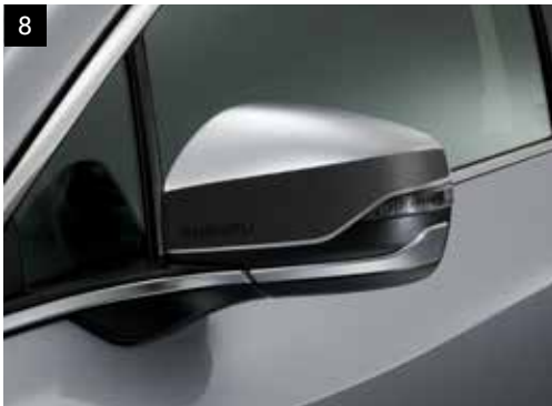
8 Dekorfolie für Außenspiegel

Ergänzt das Fahrzeugdesign und bietet wirksamen Schutz vor leichten Steinschlägen im unteren Bereich der Fahrzeugseite.