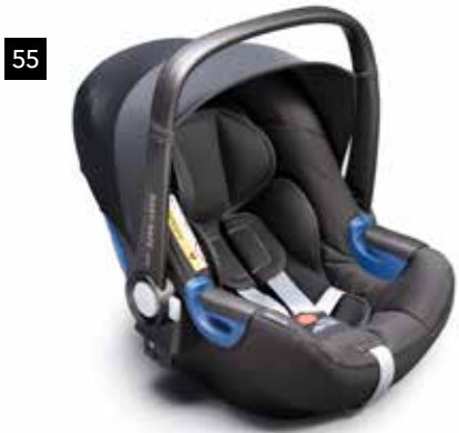
55 Kindersitz SUBARU Babysafe i-Size F410EYA300