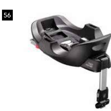
56 Kindersitz SUBARU Babysafe i-Size Flex Base F410EYA310

Verbesserte Ergonomie und EURO NCAP getestet. Zur Nutzung mit F410EYA310.