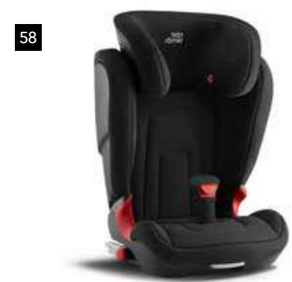
58 Kindersitz SUBARU Kidfix 2 R F410EYA260

Verbesserte Ergonomie und EURO NCAP getestet.