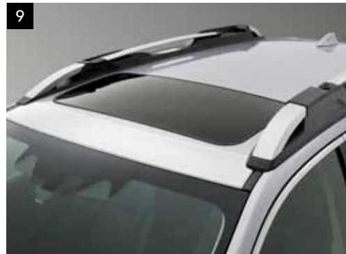
9 Steinschlagschutzfolie für das Fahrzeugdach

Eine Spezialfolie, die den Außenspiegeln einen völlig neuen Look verleiht. *Set mit 2 Folien für links und rechts.