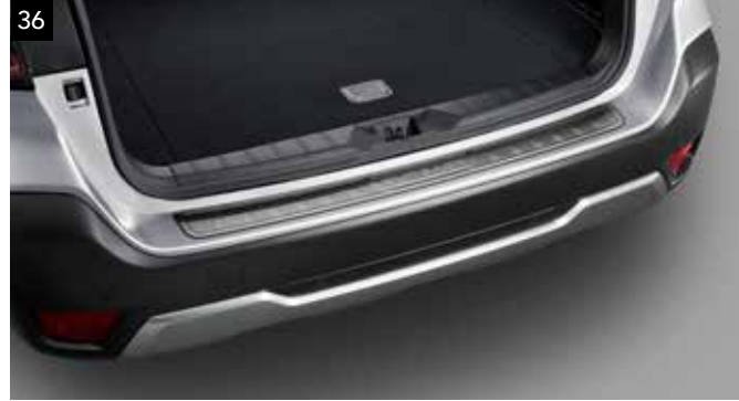
36 Ladekantenschutz (Edelstahl)

Zum Schutz des hinteren Stoßfängers beim Ein- und Ausladen.