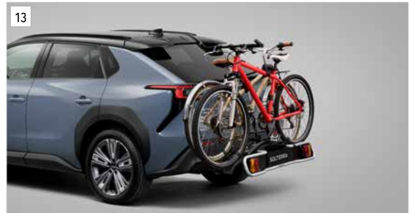
13 Fahrradabsatz für Anhängerkupplung (2 Räder) E365EFJ200

Fahrradabsatz mit Anschluss an Anhängerkupplung. Anhängerkupplung und Elektroeinbausatz 13-polig erforderlich. Max. Zuladung bei einem Fahrrad 20 kg, bei 2 Fahrrädern 36 kg.