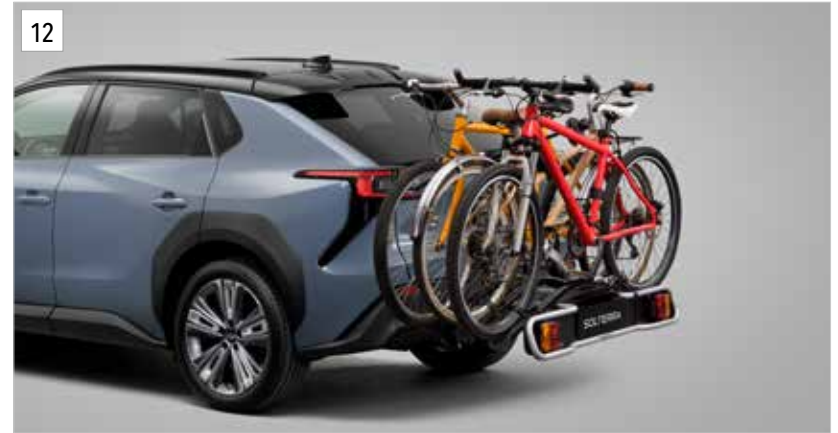
12 Fahrradabsatz für Anhängerkupplung (3 Räder) E365EFJ400

Fahrradabsatz mit Anschluss an Anhängerkupplung. Anhängerkupplung und Elektroeinbausatz 13-polig erforderlich. Max. Zuladung bei einem Fahrrad 20 kg, bei drei Fahrrädern 45 kg.