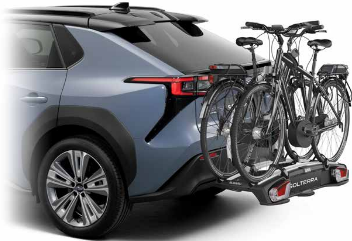
11 Fahrradabsatz für Anhängerkupplung (E-Bike) SETHYA7000

Zum Transport von 2 E-Bikes. Anhängerkupplung und Elektroeinbausatz 13-polig erforderlich. Max. Zuladung bei einem Fahrrad 20 kg, bei 2 Fahrrädern 56 kg.