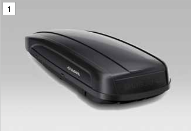
1 Dachbox Sport (Schwarz / Silber)