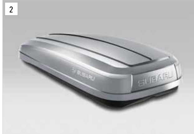
2 Dachbox Standard (Schwarz / Silber)

*in Verwendung mit Aluminium-Dachgrundträger.