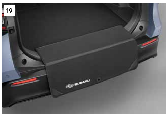
19 Textiler Ladekantenschutz

Matte aus rutschfestem Material, die das Gepäck im Laderaum vor dem verrutschen schützt.