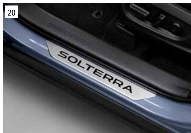
20 Türeinstiegsleiste (Edelstahl)

Zum Schutz der Ladekante und der Stoßfängeroberfläche vor Kratzern beim Ein- und Ausladen.