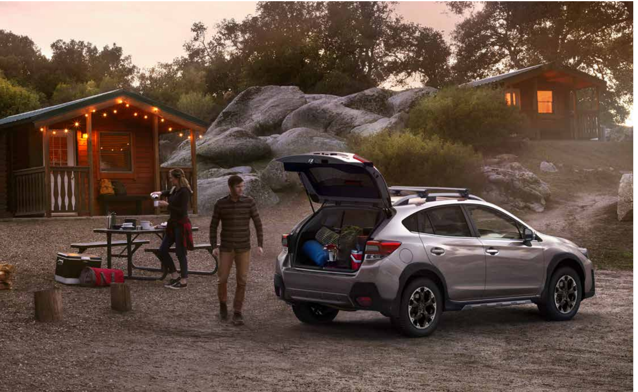
Abbildung Seite 11: Stoßstangenschutz hinten Kunststoff, Ladekantenschutz Kunststoff, Schmutzfängersatz vorne, Schmutzfängersatz hinten, Aluminium-Dachgrundträger C-Slot (für Fahrzeuge mit Dachreling), Einstiegsschweller.