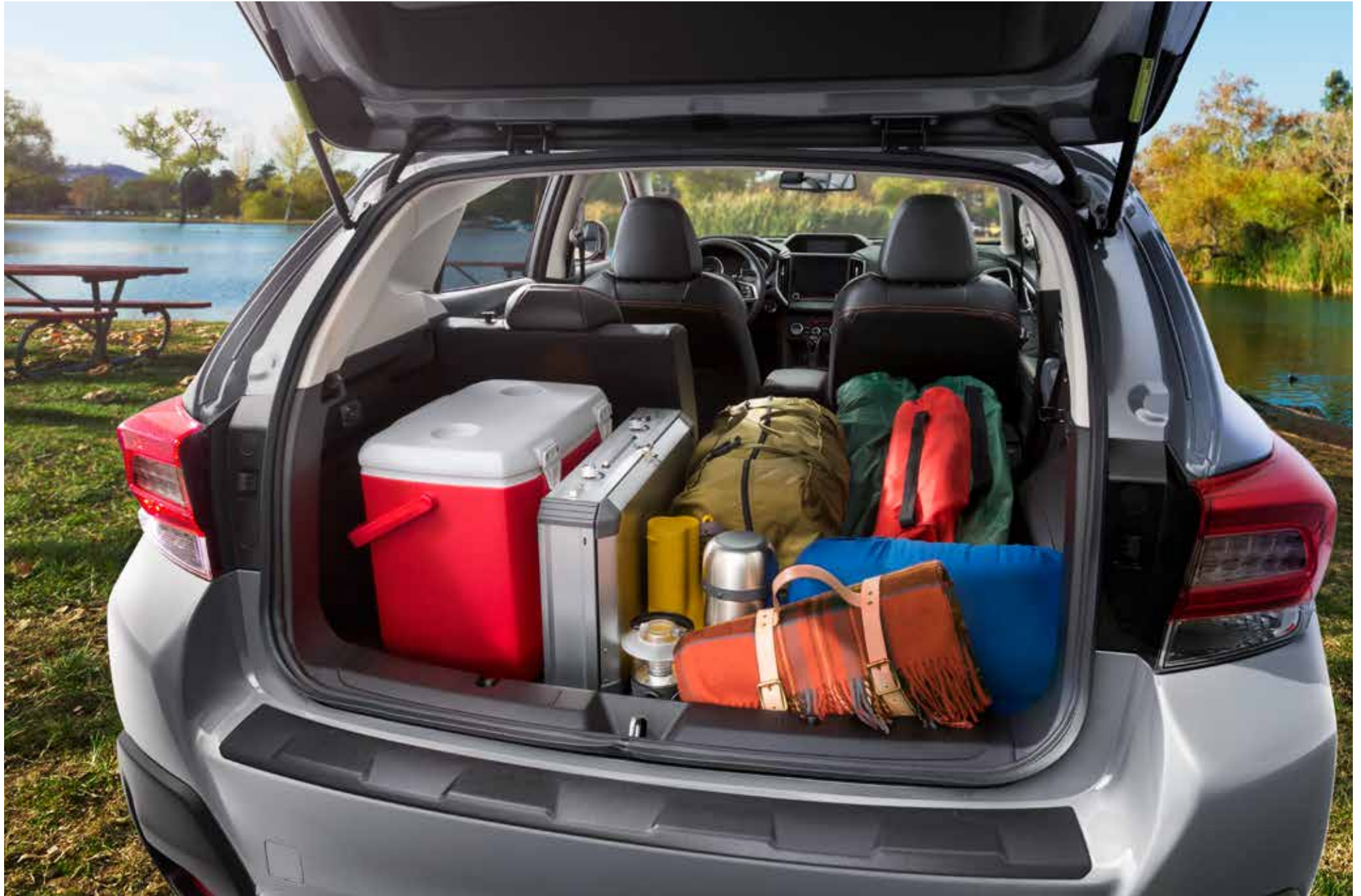
Abbildung Seite 18: Ladekantenschutz Kunststoff.