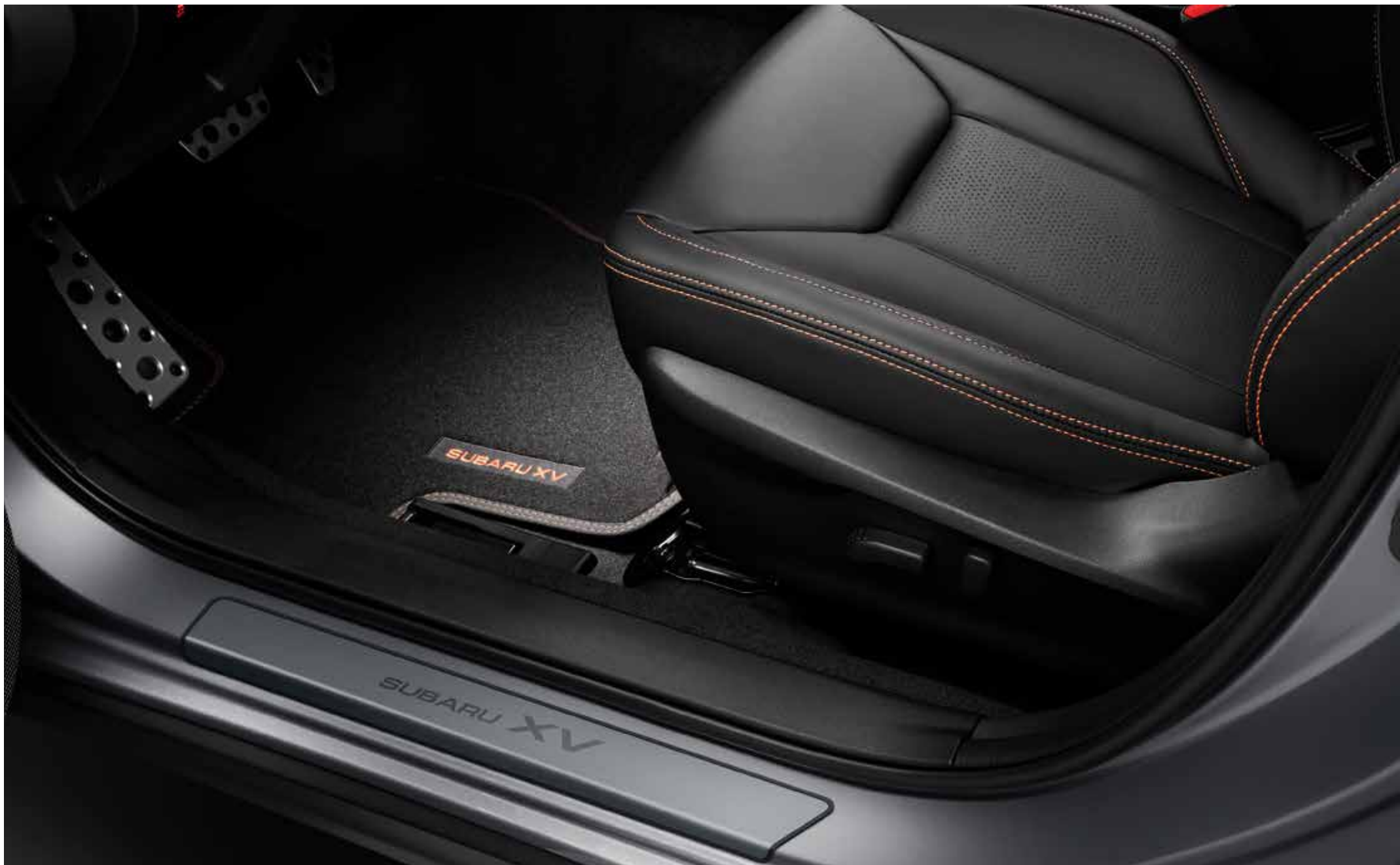
Abbildung Seite 14: Teppichmattensatz Premium, Türeinsteigsleiste (Edelstahloptik).