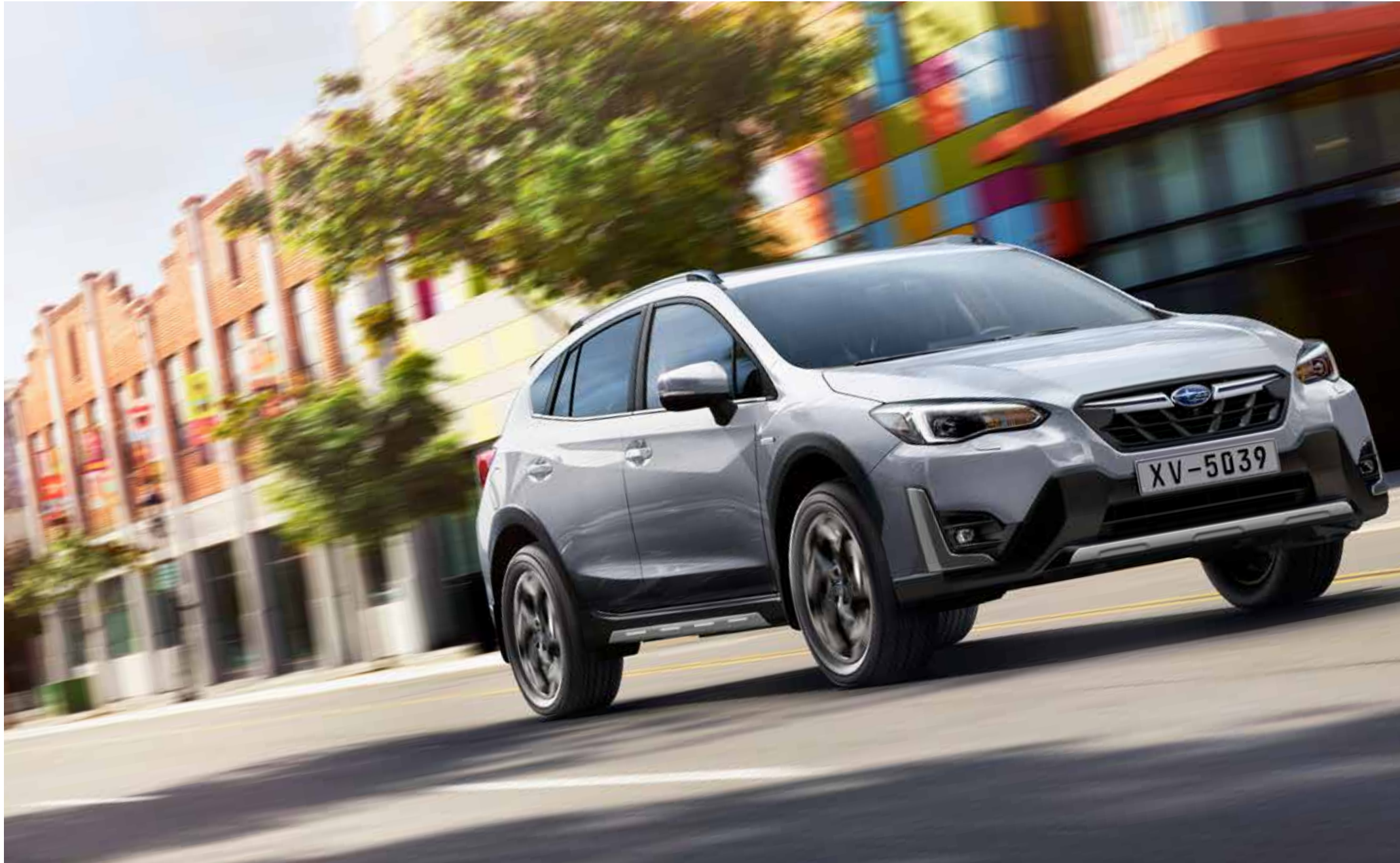
Abbildung Seite 4: Stoßtangenschutz vorne, Einstiegsschweller, Schmutzfängersatz vorne, Schmutzfängersatz hinten.